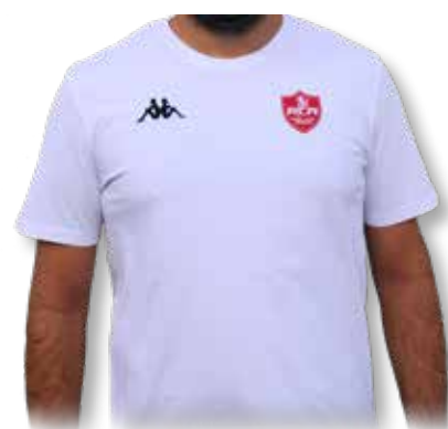
TEE-SHIRT Adulte H/F ..... 22€ TEE-SHIRT Enfant ..... 16€