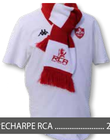
* ECHARPE RCA ..... 20€