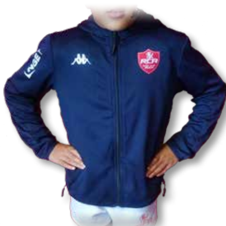
VESTE Adulte ..... 40€ VESTE Enfant ..... 35€