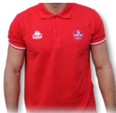
POLO BLANC Adulte ..... 35€ POLO ROUGE Adulte ..... 35€ POLO ROUGE Junior ..... 30€