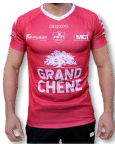
* MAILLOT REPLICA Adulte ..... 60€ * MAILLOT REPLICA Junior ..... 50€