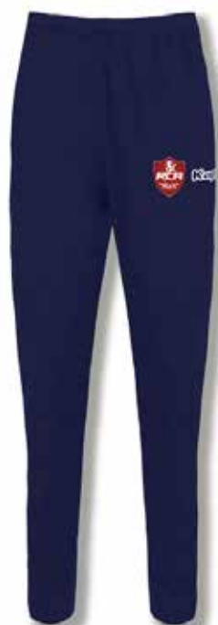
* JOGGING RCA ..... 24€