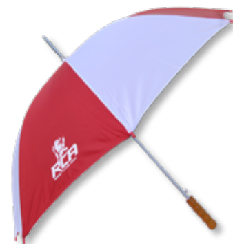
PARAPLUIE RCA ..... 15€

Pour les tailles, renseignez-vous directement à la boutique.