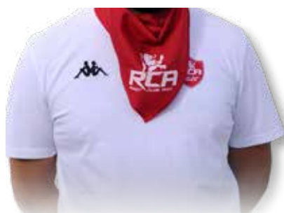
FOULARD RCA ..... 5€